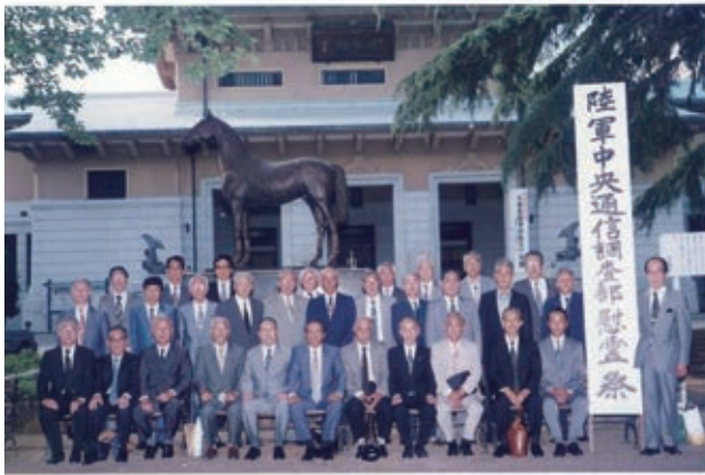
中 國 - ツ 木 会 五 十 年 祭 平成7年5月27日