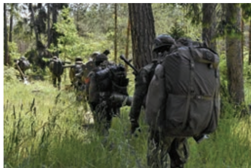
スウェーデン・ゴトランド島で行われた NATO 軍との合同訓練で、林の中を歩くスウェーデン軍 (2022年6月8日)

てきた。ロシアとは国境を接していないが、ウクライナ侵攻が始まってからバルト海に浮かぶゴトランド島周辺でロシア軍機によるスウェーデンの領空侵犯が起きた。