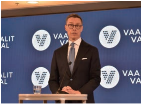
フィンランド大統領に当選した直後に首都ヘルシンキで記者会見するアレクサンデル・ストゥブ氏 (2024年2月11日)

材としての役割がフィンランドから消えた。米国の「核の傘」にも入り、NATOの核抑止政策にも関与していくことになる。フィンランドでは外交・安全保障政策で先導的役割を担うのは、軍最高司令官でもある大統領だ。数ある職務の中でも手腕問われる最大の課題がロシアとの向き合い方だとされる。今年1～2月に6年ぶりに行われた大統領選で2014～15年に首相を務めたアレクサンデル・ストゥブ氏が選ばれ、3月1日に就任した。